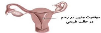
موقعیت جنین در رحم در حالت طبیعی