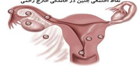
نقاط احتمالی جنین در حاملگی خارج رحمی

سطح هورمون بارداری کمتر از حد مورد انتظار می‌تواند دال بر حاملگی خارج رحمی باشد.